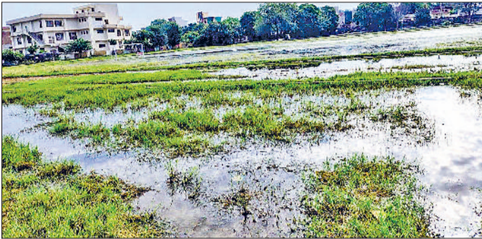
नारनौल। स्टेडियम में जमा बारिश का पानी।

खिलाड़ियों का कहना है कि जिले का एकमात्र स्टेडियम ही इस तरह बदहाल रहना, तो यहां के खिलाड़ी कभी भी राष्ट्रीय और अंतरराष्ट्रीय स्तर पर अपनी पहचान नहीं बना पाएंगे। खेल प्रतिभाओं को