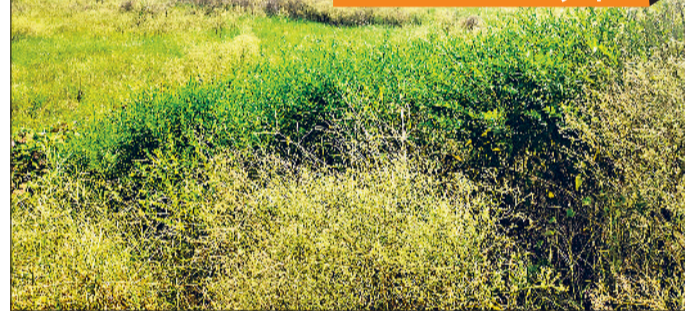
हरियाली को नुकसान पहुंच रहा है और सबसे बड़ी बात यह कि कॉलेज शिफ्ट होने

के बाद से अब तक कोई खेल गतिविधि नहीं हो पाई है।