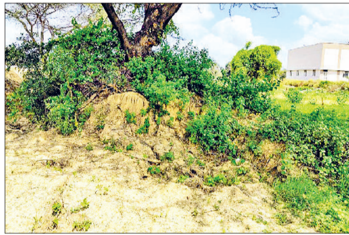
मंडी अटेली। महंत खेतानाथ राजकीय महाविद्यालय के नये भवन के खेल मैदान में ठेकेदार उठाई गई मिट्टी व महाविद्यालय में पार्किंग टैनशेड के ऊपर अभी तक नहीं लगी चढ़रें।

इससे मैदान गड्ढों में तब्दील हो गया है तथा बरसात के मौसम में खेल मैदान में जलभराव की समस्या रहने लगी। मैदान में न केवल जलभराव रहता है, बल्कि पेड़ों की जड़ें भी उखड़ने लगी हैं। इससे