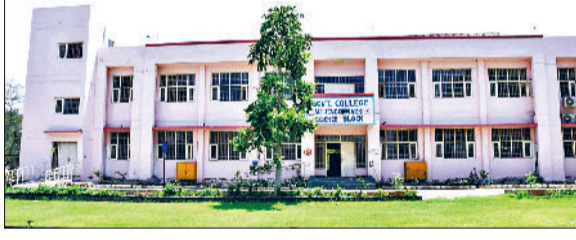
महेंद्रगढ़। कॉलेज भवन।