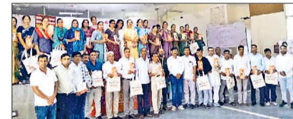
नारनौल। शिक्षकों को सम्मानित करते हुए।

निपुण हरियाणा मिशन के अंतर्गत संपर्क फाउंडेशन एवं शिक्षा विभाग की ओर से संपर्क स्मार्ट पाठशाला व संपर्क टीवी के बेहतरतम उपयोग करने वाले 24 उत्कृष्ट विद्यालयों के 67 अध्यापकों व जिले के 35 मैटर्स को सम्मानित किया गया। सम्पर्क फाउंडेशन की ओर से भव्य टीचर ट्रॉफी अवॉर्ड्स सम्मान समारोह का आयोजन शिक्षकों, विद्यार्थियों और मार्गदर्शकों को शिक्षा के क्षेत्र में उनके उत्कृष्ट योगदान के लिए सम्मानित करने के लिए किया गया। इसका मुख्य उद्देश्य निपुण हरियाणा और एफएलएन कार्यक्रम के तहत शिक्षा की गुणवत्ता को और ऊंचाई पर ले जाना रहा। कार्यक्रम में जिला परियोजना समन्वयक डॉ.