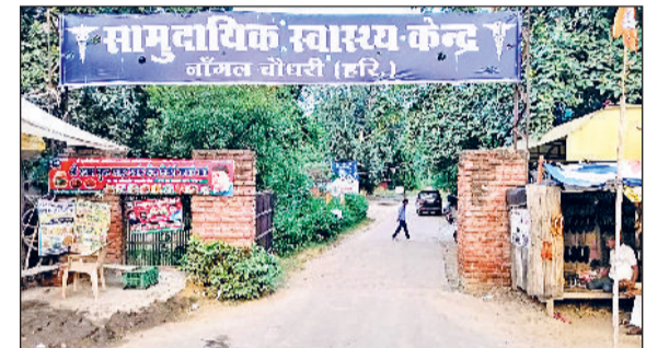
निजामपुर। सीएचसी नांगल चौधरी का प्रवेश द्वार।

विभागीय या डिग्री धारक चिकित्सकों की ओर से दवाई की निर्धारित डोज देकर इलाज किया जाता है, जिससे मरीज को तत्काल राहत नहीं मिलती। परेशान होकर कई मरीज झोलाछाप डॉक्टरों के क्लीनिक पर हाइडोज एंटीबायोटिक दवा खाते हैं। इस दवाई मरीज को तत्काल राहत मिलेगी और संतुष्ट मरीज इसी डॉक्टर की तारीफ करते हैं। जिससे नांगल चौधरी के गांवों में झोलाछाप डॉक्टर व एंटीबायोटिक्स दवाइयों की खपत तेजी से बढ़ रही है। लेकिन एंटीबायोटिक्स का अंधाधुंध इस्तेमाल से मरीजों की किडनी, लीवर व रोगप्रतिरोधक क्षमता को नुकसान होने लगा है। आपकों बता दें कि स्वास्थ्य