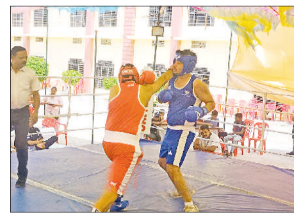
कनीना। प्रतियोगिता में भाग लेते खिलाड़ी।