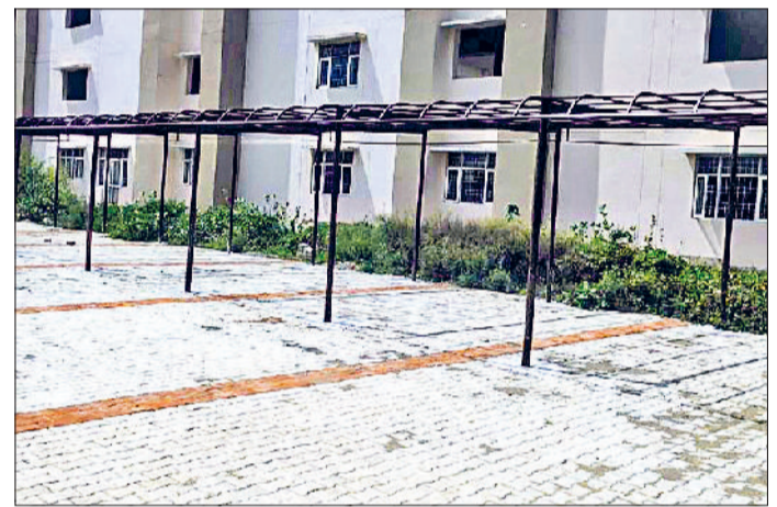
मंडी अटेली। महंत खेतानाथ राजकीय महाविद्यालय के नये भवन के खेल मैदान में ठेकेदार उठाई गई मिट्टी व महाविद्यालय में पार्किंग टैनशेड के ऊपर अभी तक नहीं लगी चढ़रें।

के बाद से अब तक कोई खेल गतिविधि नहीं हो पाई है।